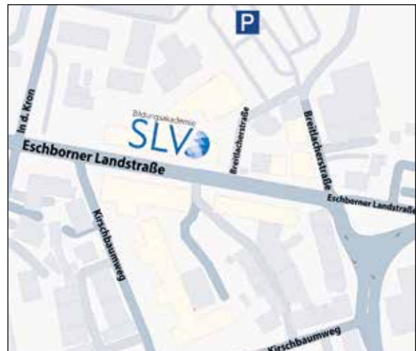
Standort Frankfurt am Main